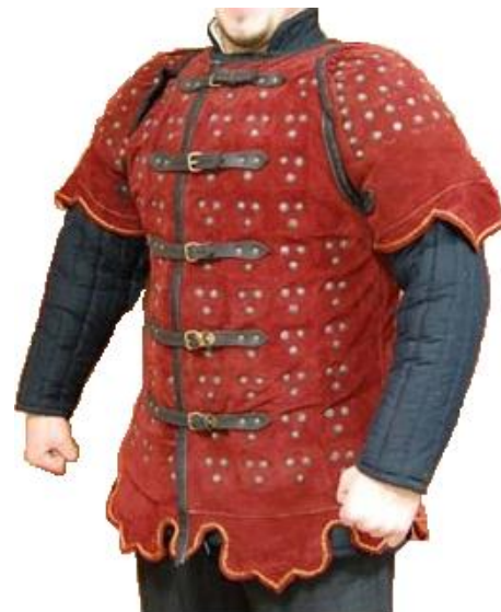
Ábrán: Egy átlagos rőtzubbonny nemesi címeres átalvető nélkül

A Rőtzubbonysokat megbízható öröknek ismerik a környékeliek, kikhez az átlag polgár is fordulhat segítségül, s igyekeznek a törvény és rend legalább látszatát fenntartani. A korrupciót igyekszik Tennvic a csoporton belül a minimumon tartani, bár a józan megfontoltságú rőtzubbonny hajlamos kenőpénzt elfogadni, ha evvel valami nagyobb kellemetlenséget kerülhet el saját vagy polgári részről. Ugyanakkor nem megátalkodottak és bolondok, hogy ezért elnézzenek nyilvánvalóan aljas büntetteket. Például lehet, hogy elfogadnak kenőpénzt egy nyilvánvalóan erősebbnek tűnő társulattól, de attól még simán jelentik őket a felettesüknek vagy Tennvic-nek. „Maradj éber, maradj hű és maradj életben!” – ahogy Tennvic szokta mondani nekik. Leginkább három fős csoportokban járőröznek vagy strázsálnak. Ebből minimum egy íjász vagy távolsági fegyverhasználó, egy pedig bír lehetőleg