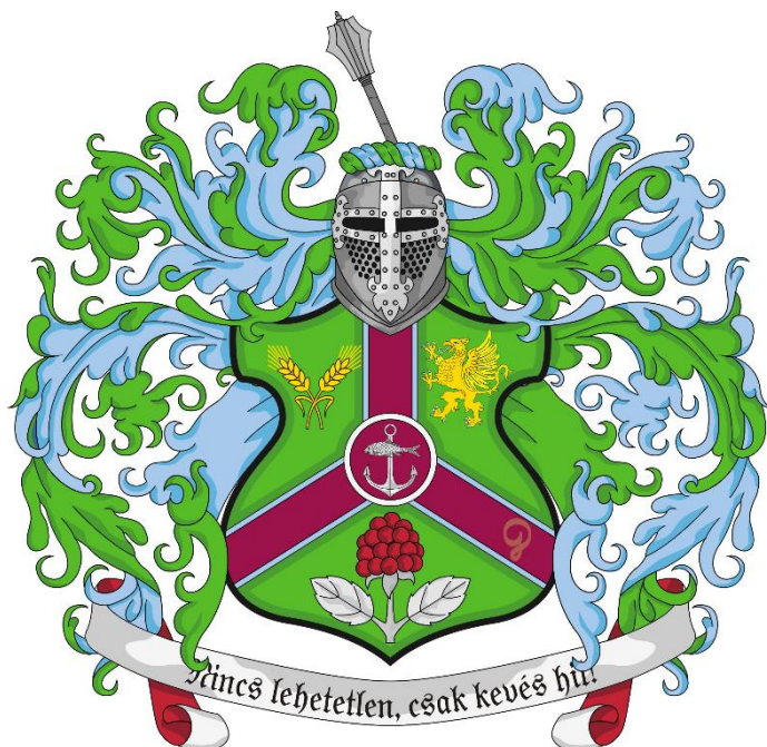
7. ábra: Mendrachar-ház címere

Kisebb shadoni nemesi család, birtokai Cormasa tartományban vannak. Innen származik Giomo del Montaron, aki Psz. 3724-ben az Egység Testvérisége lovagrend nagymesteri címét viseli. A család tagjai nevükben a del nemesi előtagot használják. Tevékenységi körük állattartás (főként juh-félék) és kereskedelem (főként tengeri).