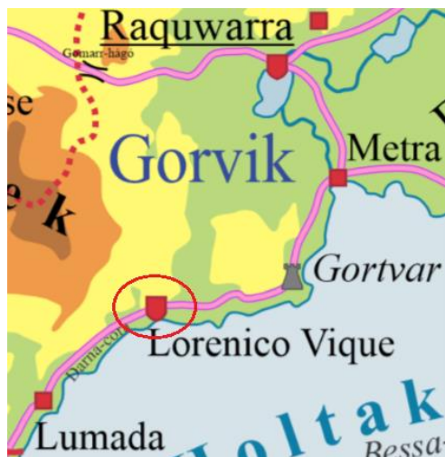
1. ábra: A rend székhelye

Újkeletű, alig 20 éves lovagrend mely unitárius elveket vall magáénak: Új-Godon egységének védelme és támogatása az Egyetlen oltalma alatt. Hitvallásuk szerint (3-5-7) a Harmadik Arc nyomán a jóságot, az összefogást, és a segítségnyújtás eszméit hirdetik, az Ötödik Arc nyomán a tudást kutatják és adják tovább az arra érdemeseknek, és a Hetedik Arc nyomán a világot és az ártatlanokat védik meg a gonosz megnyilvánulásaitól az exterminus szentsége által. A rend védőszentje a Szent Liga soraiban harcolt mártírhálált halt tisztaszívú Sigill, minekután egyszerűen csak sigillánusokként is emlegetik őket. A lovagrend védnöke névleg I. Linora királynő, székhelye pedig Lorenico Vique városa (1. ábra), ahol a rendi tanács is székel. Nagymestere a nemrég választott (Psz. 3724.) Giomo del Montaron, ki a megüresedett mesteri posztra épp jelöltet keres. Több kisebb rendházuk is van Új-Godon területén, és a rend számos kalandort is tudhat a tagjai között: többségük kalandor lovag,