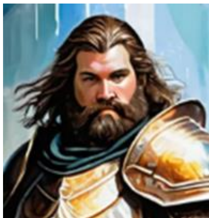
2. ábra: Dario am Cormana

Jellegetes kalandor csapat a rend kötelékéből a Dario Testvérek néven emlegetett társaság, kik általában hárman kalandoznak, de hosszabb- rövidebb időre társulnak más rendtagokkal is. Vezetőjük leiosz thaira Dario am Cormana, Domvik felkent paplovagja, kinek elmaradhatatlan társai a Benignus-rendi leiosz Dario Magna atya és a szerep Dario Bratus szolgáló testvér.