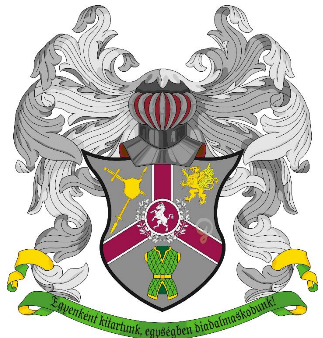
8. ábra: Montaron-ház címere